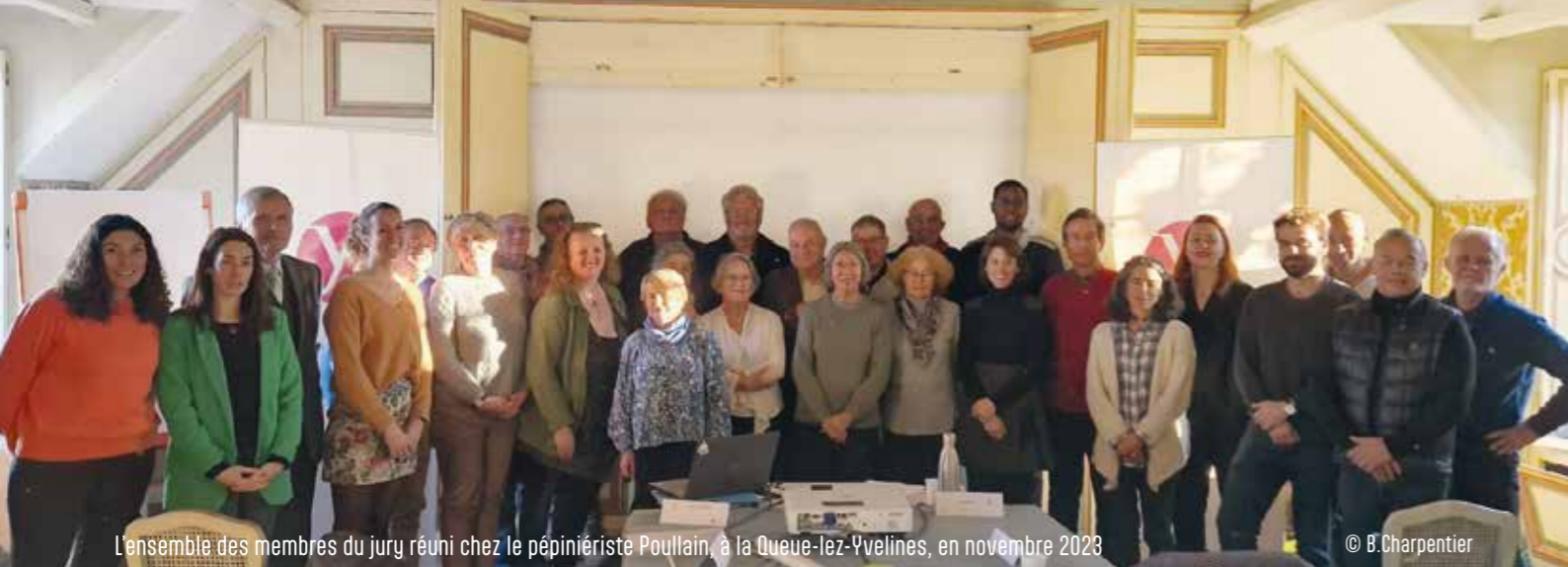
L'ensemble des membres du jury réuni chez le pépiniériste Poullain, à la Queue-lez-Yvelines, en novembre 2023