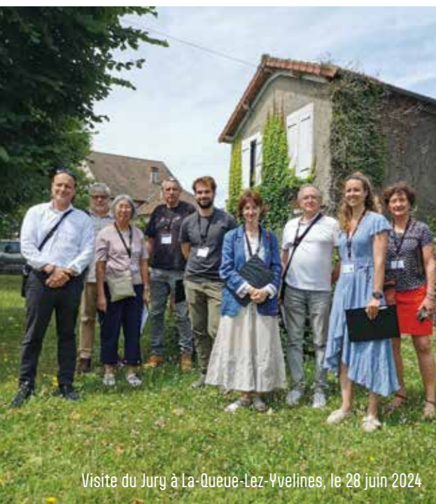
Visite du Jury à La-Queue-Lez-Yvelines, le 28 juin 2024