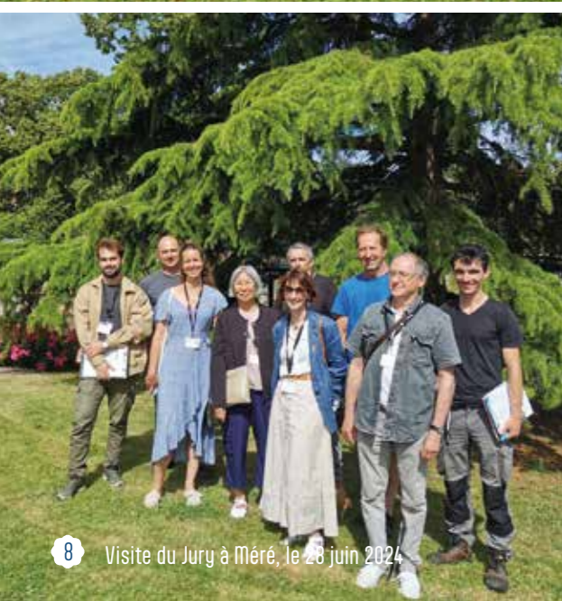
8 Visite du Jury à Méré, le 28 juin 2024